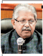
सभापति धरमलाल कौशिक ने पक्ष-विपक्ष के सभी सदस्यों को दिया धन्यवाद

छत्तीसगढ़ विधानसभा के बजट सत्र के आखिरी दिन सभापति धरमलाल कौशिक ने पक्ष-विपक्ष के सभी सदस्यों को धन्यवाद दिया। उन्होंने कहा, सभी के सहयोग और मार्गदर्शन से ही वे अपने दायित्वों का सफलतापूर्वक निर्वहन कर सके।