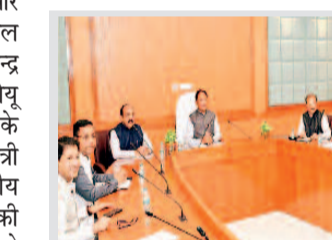
मुख्यमंत्री ने बताया कि राज्य में अब तक 41 लाख 30 हजार से अधिक ग्रामीण परिवारों यानी लगभग 82.66 प्रतिशत घरों को नल कनेक्शन उपलब्ध कराया जा चुका है। श्री साय ने कहा कि जल जीवन मिशन के तहत दूरस्थ, वनांचल और आदिवासी क्षेत्रों तक शुद्ध पेयजल पहुंचाने से महिलाओं को बड़ी राहत मिलेगी, जिन्हें पहले पानी के लिए दूर-दूर तक जाना पड़ता था।

प्रदेश के गांवों में 41 लाख 30 हजार घरों में नल